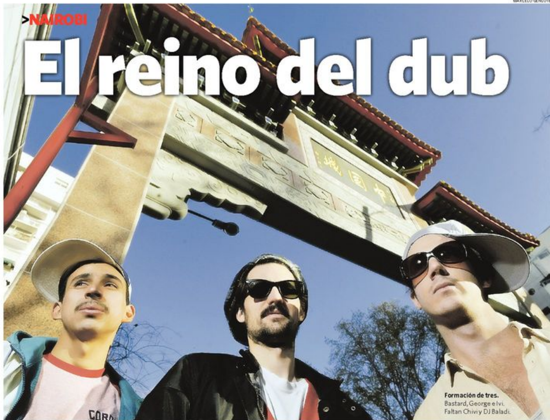
Formación de tres. Bastard, George e Ivi. Faltan Chivy y DJ Baladi.

Mientras los argentinos ganan elogios con su debut "Wu Wei", el género nacido en Jamaica se renueva y suma puntos con la nueva obra de Franz Ferdinand y un documental sobre el tema.